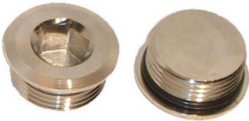
Nickel, 1" AG + Imbuss