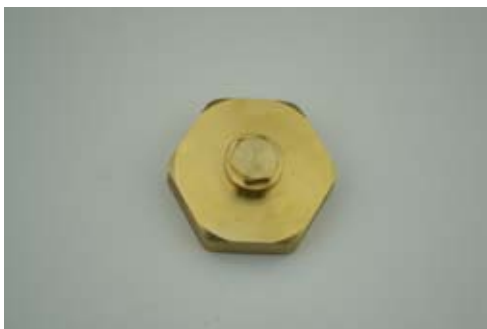
1 1/2" Innengewinde x 1/2" Innengewinde mit 1/2" Stopfen in Edelstahl oder Messing